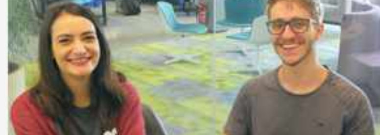
Webinar: Treinamento Básico Arquivei

Nossos conteúdos não terminam por aqui, aprenda ainda mais na Academia Arquivei.