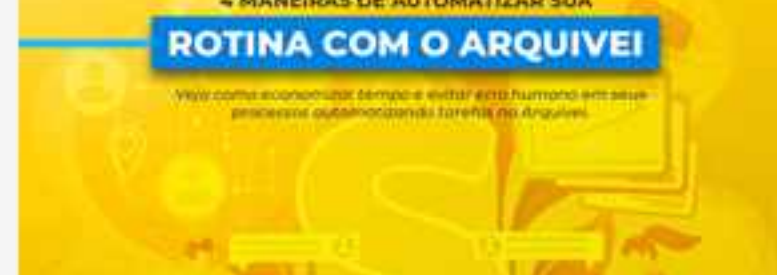
Infográfico: 4 maneiras de automatizar sua rotina no Arquivei